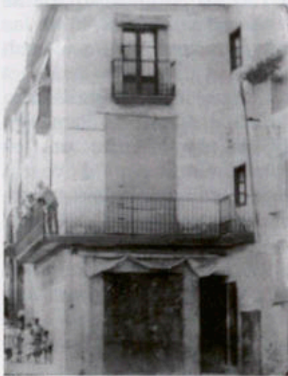
El café "Mateu" a principis de segle XX

Las festas de Pasqua han resultat enguany lluidas com sempre. Ni més ni menys que festa major com ho acostuman a semblar totas las festas anyals y alguns diumenges d'entre any, y tot per las competencias que no s'acaban may per ací. També hem sentit músicas, pianos de curru y gralls que feyan las sevas tocadas en los balls respectius. També hi podém anyadir, enguany, una nova divertició com es la representació de "La gent del any vuyt", feta en un teatret del "Café Mateu" per uns quants aficionats y dos cómichs forasters. No hi vam assistir però sabem de bona tinta qu'agradá bastant als espectadors. Com totas las festas d'aquest poble, s'acabá ab un ball, prenenhi part activa bastantas vellas del poble.