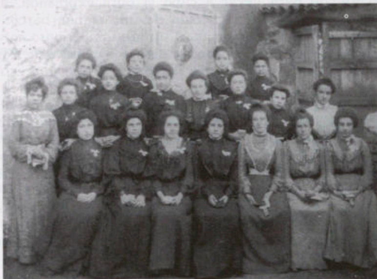
Filles de Maria de 1905 Gira-Sol, nº 30

forsa bó. En conjunt un dia de vera expansió espiritual pels devots de la Inmaculada Concepció. Nostre Sr. Rector sembla que ha donat una bona empenta a la Associació de las Fillas de Maria, tant decaiguda finsas ara, lo que no duptém contribuirá en extrém a la moralisació de la joventut. Que rebi, donchs, nostra enhora bona.